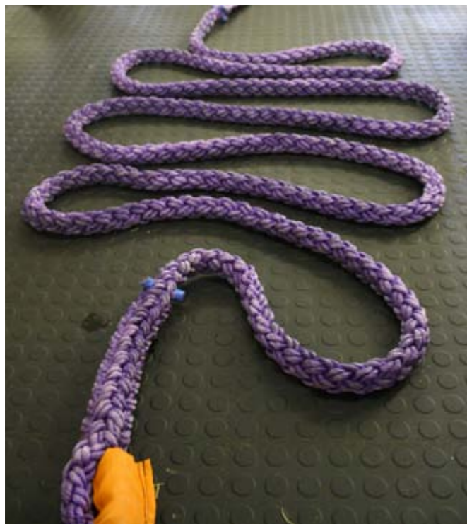
Onderskrif. Ut illab ipid qui omnimam nihilla ccatemqui ra pe volum illat aut exero te ventiis is doles raesequ idenisSum am cus moleseceptae la

'n Behoorlike herwinningspunt is 'n gegeradeerde haak of lus wat direk aan 'n voertuig se onderstel vasgebout is met hoëspanningstaalboute wat met 'n wringsleutel ( torque wrench ) vasgedraai is.