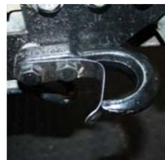
Onderskrif. Ut illab ipid qui omnimam nihilla ccatemqui ra pe volum illat aut exero te ventiis is doles raesequ idenisSum am cus moleseceptae la

*In die Junie-uitgawe van WegRy gee ons nog herwinningswenke.