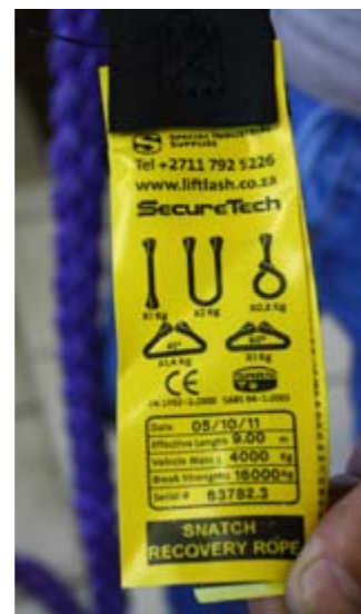
Onderskrif. Ut illab ipid qui omnimam nihilla ccatemqui ra pe volum illat aut exero te ventiis is doles raesequ idenisSum am cus moleseceptae la